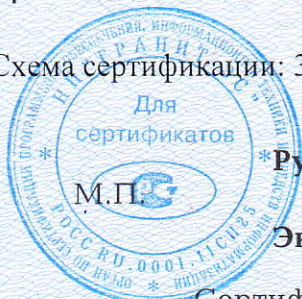
Схема сертификации: 3.